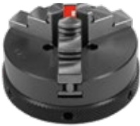
Blanker Stahl oder korrosionsgeschützt

Futtergrössen ab \varnothing 30 mm, verschiedene Backen & Spezial-Ausführungen