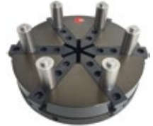
Alu-Stiftbacken- futter, \varnothing = 80 , 160, 240 mm