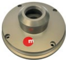
NEU: ER16 + ER20 ultraleicht < 1 kg drehbar