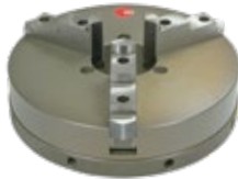
Aluminium (übergrosse \varnothing nach Absprache)