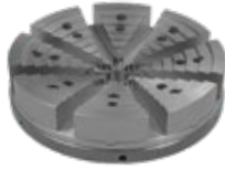
Blanker Stahl oder korrosionsgeschützt